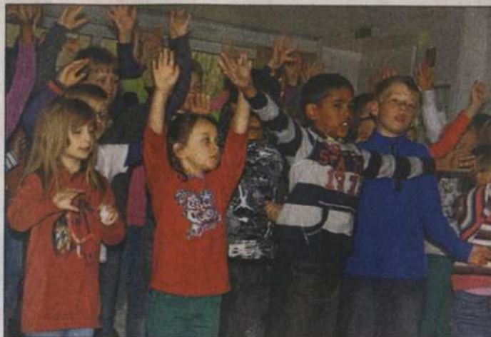
Die Hände zum Himmel: Der Chor feilt an der Körpersprache.

Proben für „Magic Drum“ laufen auf Hochtouren / Premiere des Kindermusicals am Freitag im Ratsgymnasium